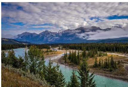
5. park narodowy –