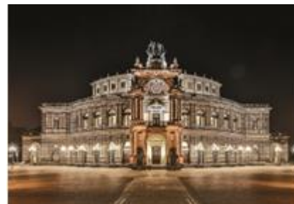
9. pałac –