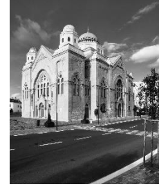
21. synagoga –