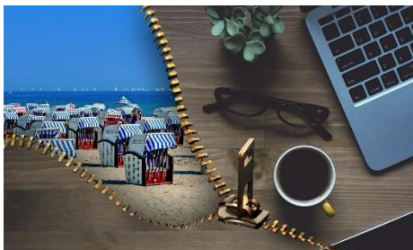
1. wczasy zorganizowane –

Zad. 2 Podpisz poniższe ilustracje w języku angielskim przedstawiające typy wakacji .