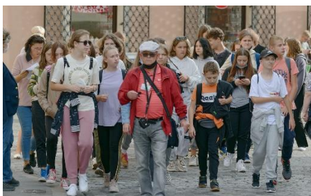
4. zwiedzanie z przewodnikiem –