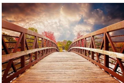
4. most –