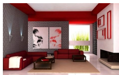
6. apartament –