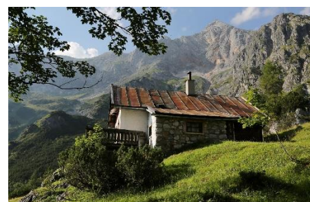
9. chata, domek (w górach) –