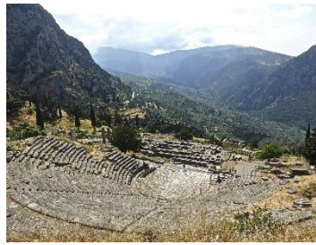
20. amfiteatr –