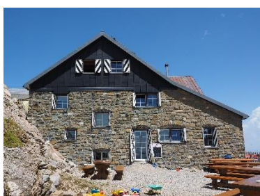
11. sala wieloosobowa w – schronisku –