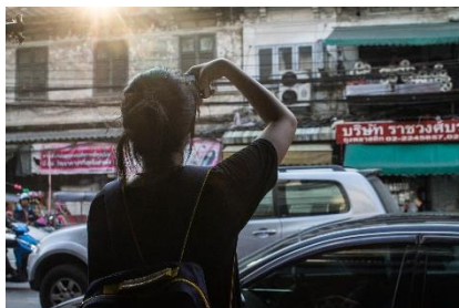
2. krótki wyjazd turystyczny do dużego miasta –