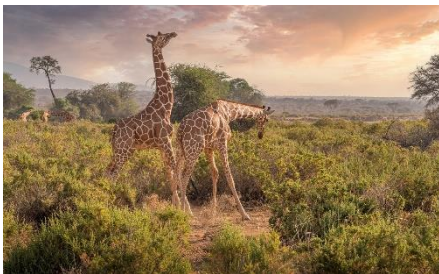
19. rezerwat przyrody –