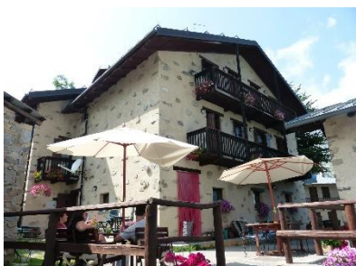
7. niedrogie zakwaterowanie –