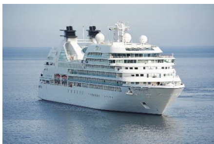
8. rejs wycieczkowy –