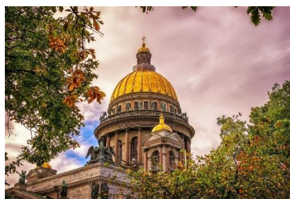
11. katedra –