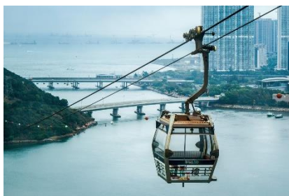
5. kolejka liniowa –