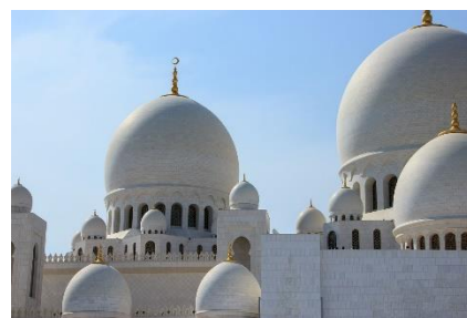
3. meczet –