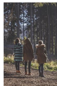
6. wycieczka – trip