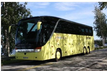
7. objazdowy wyjazd turystyczny – touring holiday