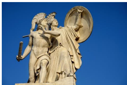
1. posąg – statue

Zad. 7 Podpisz poniższe ilustracje w języku angielskim związane ze zwiedzaniem .