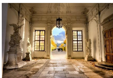
23. muzeum – museum