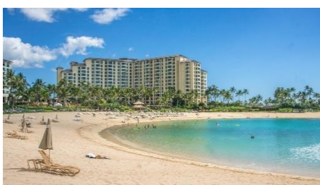
4. kurort wypoczynkowy – holiday resort