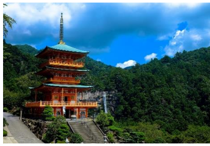
17. świątynia – temple