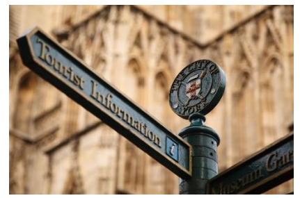
18. informacja turystyczna – tourist information