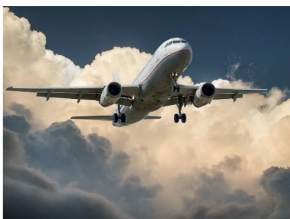
10. samolot – plane