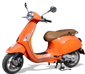
4. skuter – moped