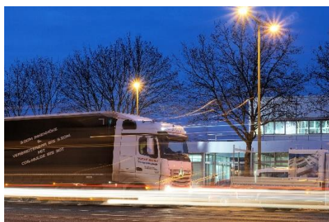
11. ciężarówka – lorry