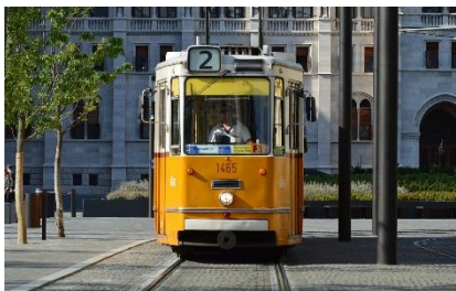
1. tramwaj – tram

Zad. 3 Podpisz poniższe ilustracje w języku angielskim przedstawiające środki transportu .