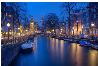
22. kanał – canal