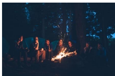
5. pole kempingowe – campsite