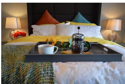
10. pensjonat oferujący nocleg ze śniadaniem – bed and breakfast