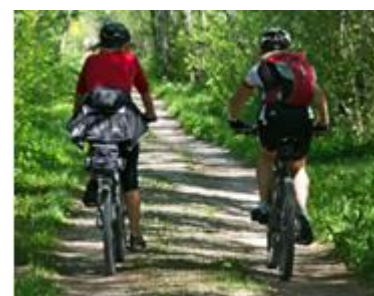
9. wczasy dla amatorów aktywnego wypoczynku – adventure holiday