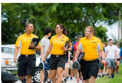
10. obóz letni – summer camp