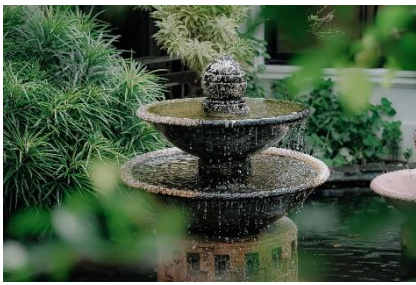
16. fontanna – fountain