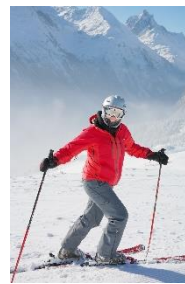
3. wyjazd na narty – skiing holiday