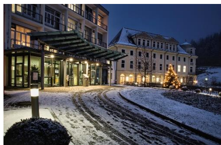
8. luksusowy hotel – luxurious hotel