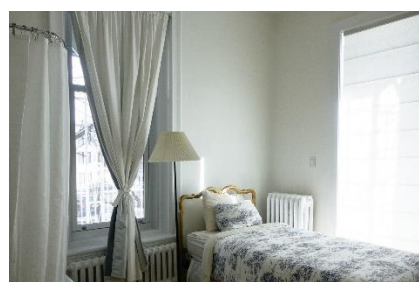
12. pokój jednoosobowy – single room