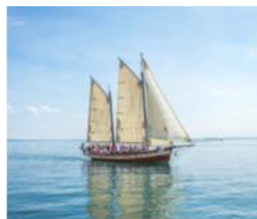
12. łódź – boat