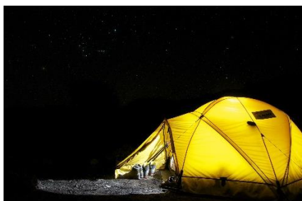
5. wakacje pod namiotem – camping holiday