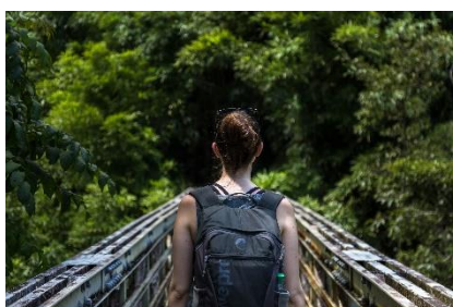
11. podróżowanie z plecakiem – backpacking holiday