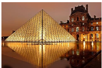
10. charakterystyczny obiekt – landmark