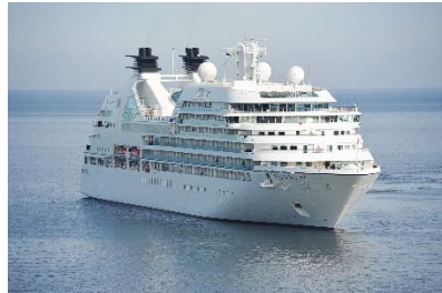
3. prom – ferry