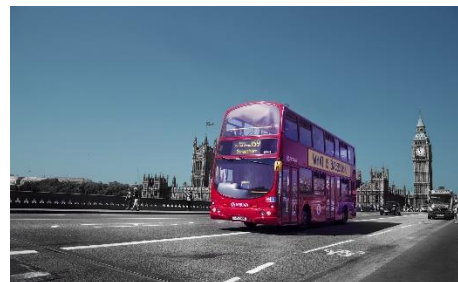
6. autobus piętrowy – double-decker