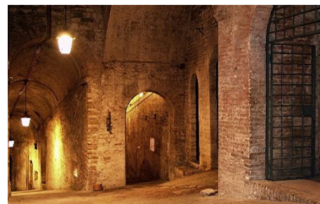
6. loch – dungeon