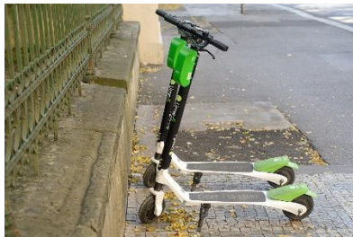
2. hulajnoga – scooter