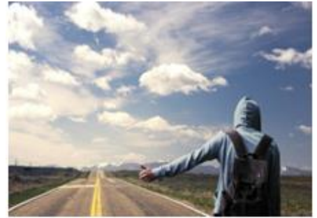
15. podróż autostopem – hitchhiking