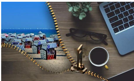
1. wczasy zorganizowane – package holiday

Zad. 2 Podpisz poniższe ilustracje w języku angielskim przedstawiające typy wakacji .