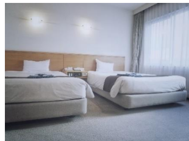
3. pokój dwuosobowy – twin room