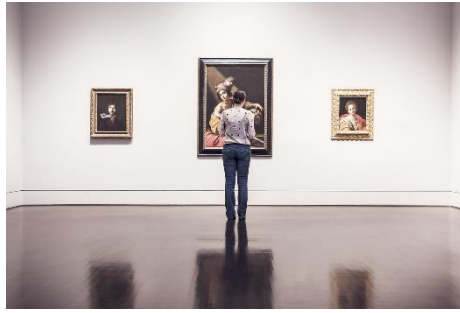
14. galeria sztuki – art gallery