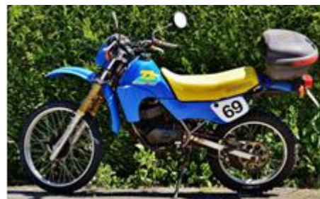
9. motor – motorbike