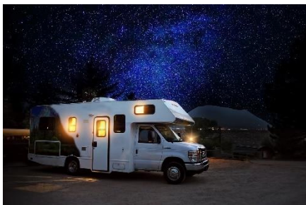
1. przyczepa kempingowa – mobile home

Zad. 1 Podpisz poniższe ilustracje w języku angielskim przedstawiające formy zakwaterowania.