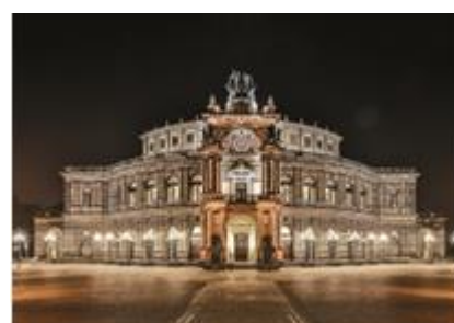
9. pałac – palace