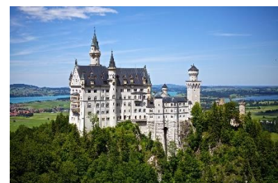
24. zamek – castle