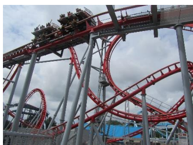
7. wesołe miasteczko – theme park