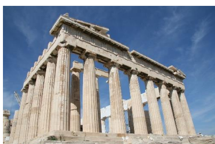
8. zabytek – monument