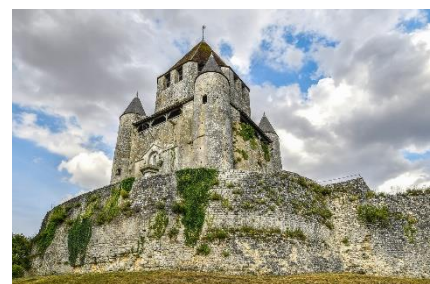
12. średniowieczna twierdza – medieval fortress