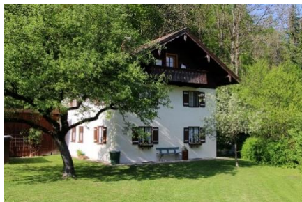
2. pensjonat – guest house