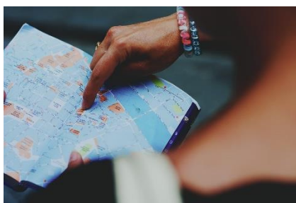
2. zgubić się – get lost