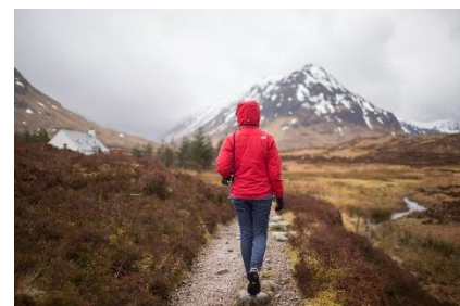
12. wyjazd wędrowny – walking holiday