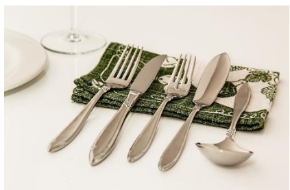
7. sztućce –