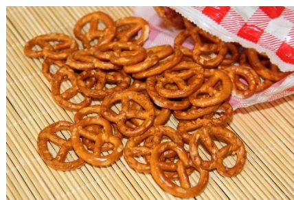
11. przekąska –