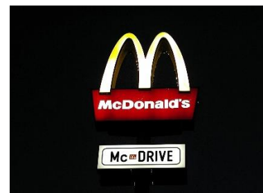
9. bar szybkiej obsługi –