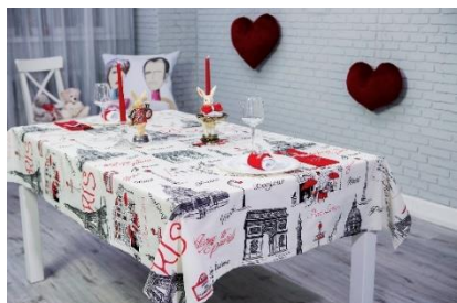
1. obrus –

Zad. 1 Podpisz poniższe ilustracje w języku angielskim przedstawiające przybory i urządzenia kuchenne.