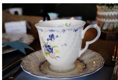
11. filiżanka –