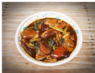
11. zupa grzybowa –