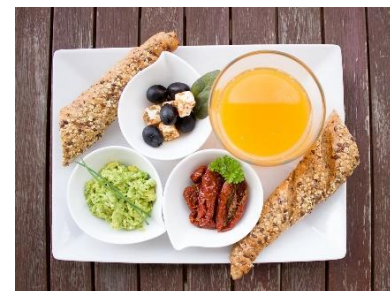
12. śniadanie –