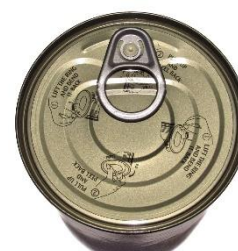
12. puszka kukurydzy –