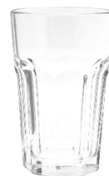
3. szklanka –