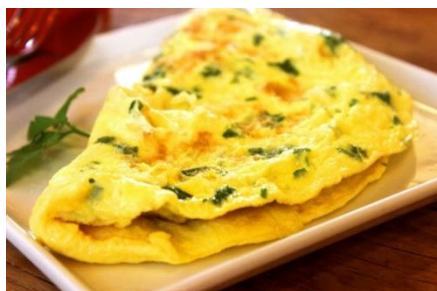
1. omlet –

Zad. 3 Podpisz poniższe ilustracje w języku angielskim przedstawiające dania .