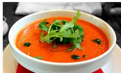
6. zupa pomidorowa –