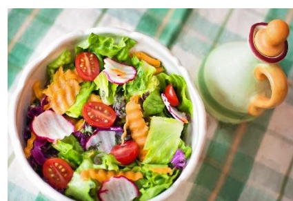
3. sałatka –