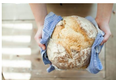
5. bochenek chleba – a loaf of bread