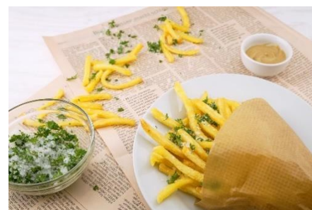
9. frytki – French fries / chips