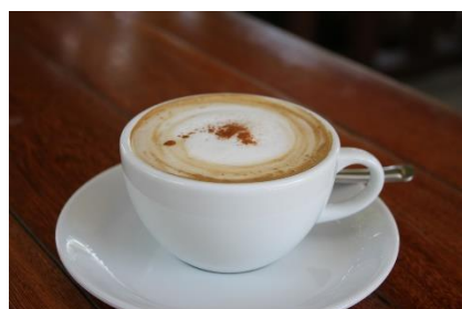
7. filiżanka kawy – a cup of coffee