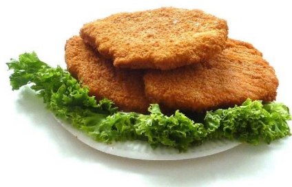
7. kotlet schabowy – schnitzel