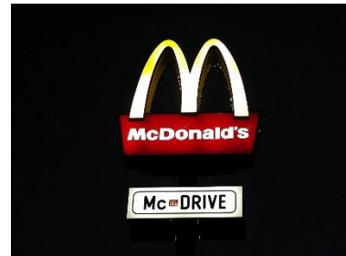
9. bar szybkiej obsługi – fast-food restaurant