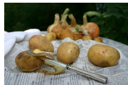
6. obierać – peel