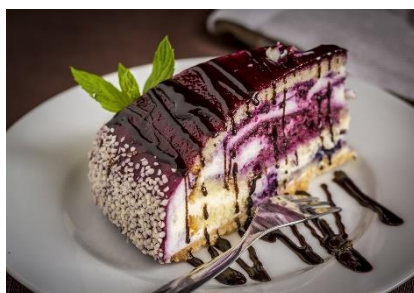
4. deser – dessert