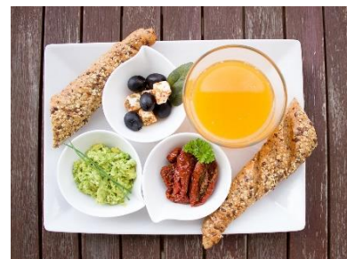
12. śniadanie – breakfast