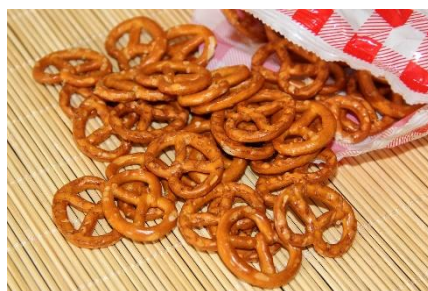
11. przekąska – snack