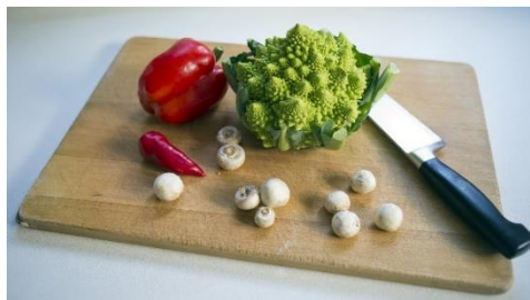
2. deska do krojenia – chopping board