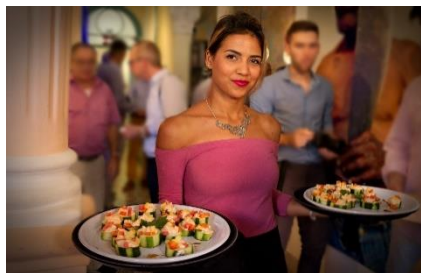
1. podawać – serve

Zad. 2 Podpisz poniższe ilustracje w języku angielskim przedstawiające czasowniki związane z gotowaniem.