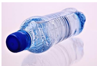
11. butelka wody – a bottle of water