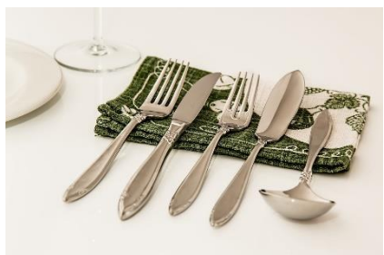
7. sztućce – cutlery