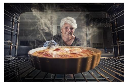
9. piec – bake