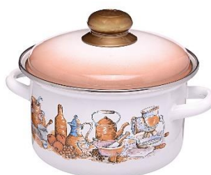
5. garnek – pot