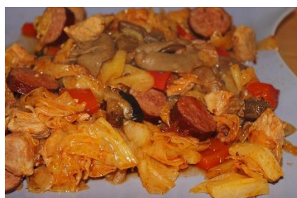
5. bigos – hunter's stew