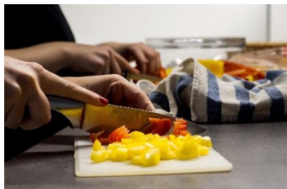
2. siekać – chop