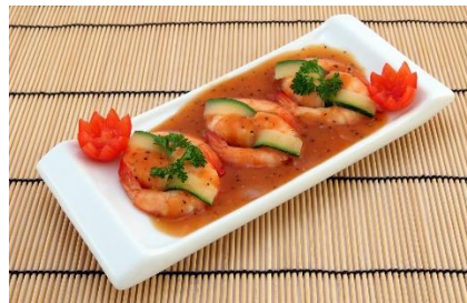
3. przystawka – starter