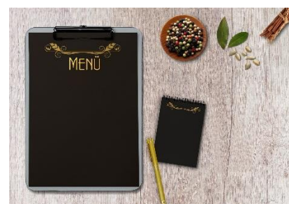
5. w karcie dań – on the menu