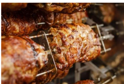
5. piec – roast