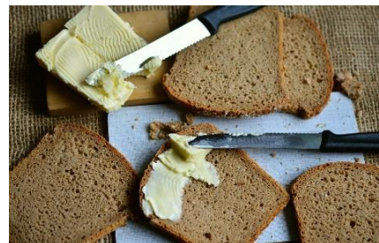
3. posmarować – spread