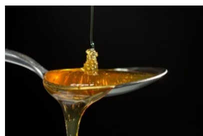
12. łyżka – spoon