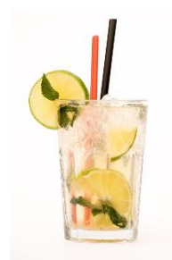
6. szklanka lemoniady – a glass of lemonade