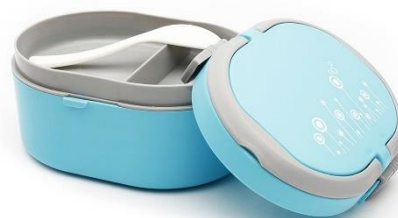
6. drugie śniadanie – packed lunch