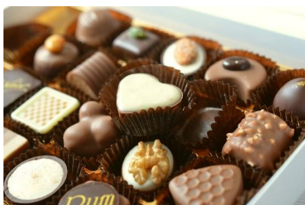
2. pudełko czekoladek – a box of chocolates