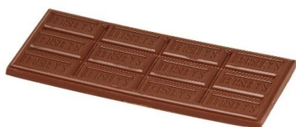
10. tabliczka czekolady – a bar of chocolate