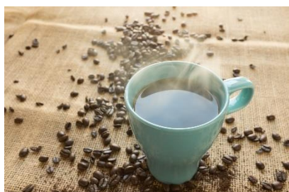
10. kubek – mug