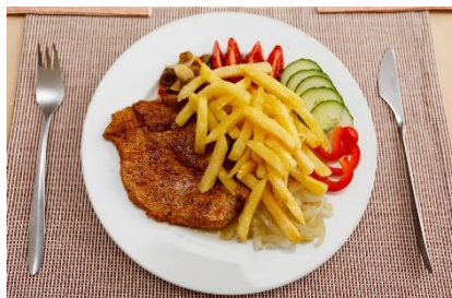
1. obiad – dinner

Zad. 5 Podpisz poniższe ilustracje w języku angielskim przedstawiające posiłki oraz słówka związane z restauracją .