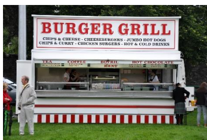
7. jedzenie na wynos – takeaway