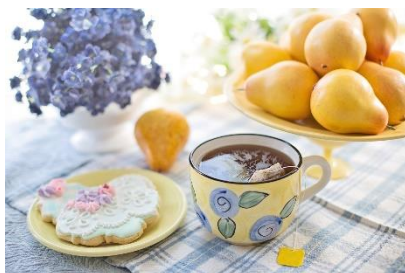
2. podwieczorek – afternoon tea