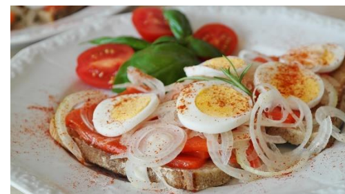
8. kolacja – supper