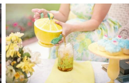
12. nalewać – pour