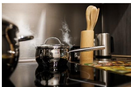
10. podgrzewać – heat up