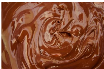
7. roztopić – melt