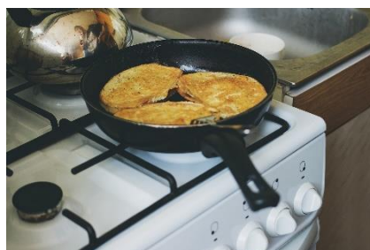
8. smażyć – fry