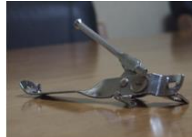
9. otwieracz do konserw – tin opener