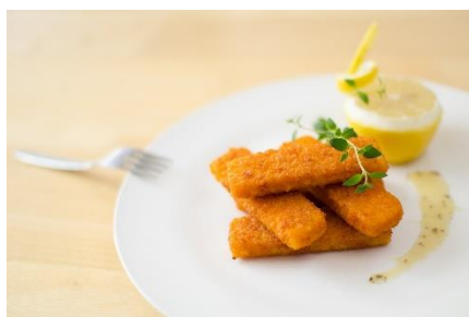
2. paluszki rybne – fish fingers