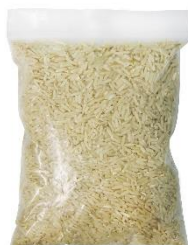
8. torebka ryżu – a bag of rice