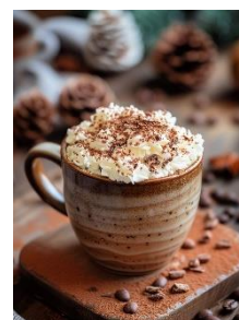
3. kubek kakao – a mug of cocoa