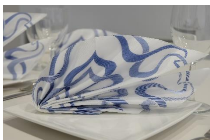
4. serwetka – napkin