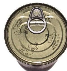
12. puszka kukurydzy – a tin of sweetcorn