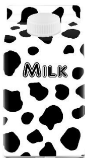
1. karton mleka – a carton of milk

Zad. 4 Podpisz poniższe ilustracje w języku angielskim przedstawiające pojemniki i opakowania.