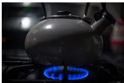
8. czajnik – kettle