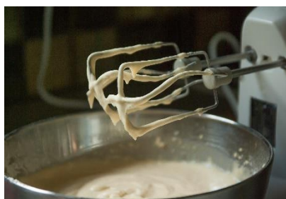
4. ubijać – beat