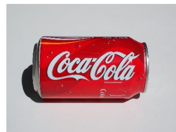
9. puszka napoju gazowanego – a can of soda