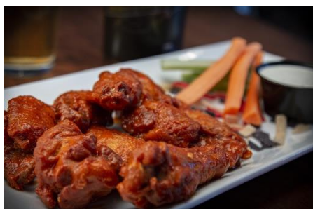
10. skrzydełka z kurczaka – chicken wings