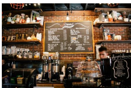
10. kawiarnia – coffee shop / café