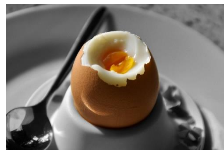
12. jajko na miękko – soft-boiled egg