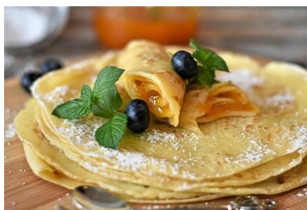
8. naleśniki – pancakes