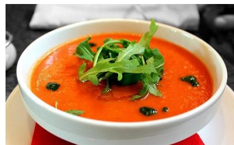
6. zupa pomidorowa – tomato soup