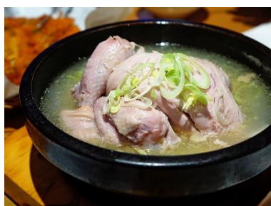
4. rosół – chicken soup