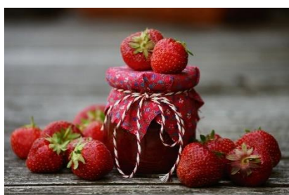
4. słoik dżemu – a jar of jam