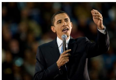
11. prezydent – president