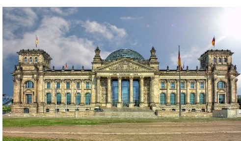
5. parlament – parliament