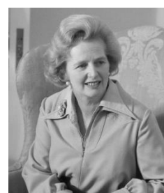
3. premier – Prime Minister