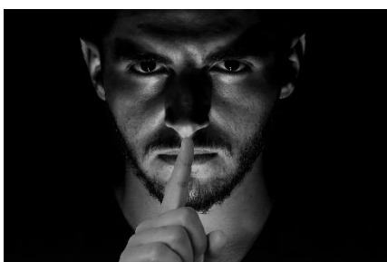
4. cenzura – censorship