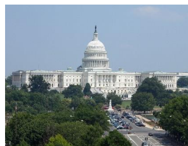
9. Kongres Stanów Zjednoczonych – United States Congress