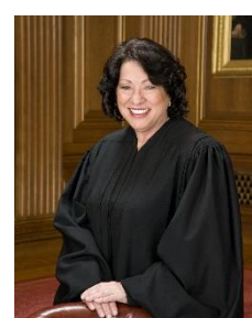
6. sędzia – judge