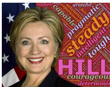
8. Sekretarz Stanu – Secretary of State