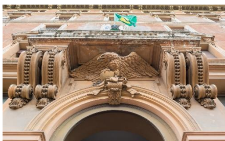
2. ambasada – embassy