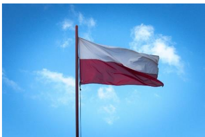
1. flaga państwowa – national flag

Zad. 1 Podpisz poniższe ilustracje w języku angielskim związane z polityką i państwem.