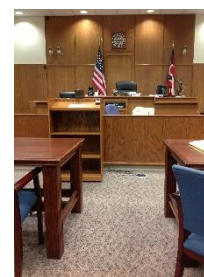
12. sala sądowa – courtroom