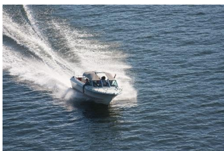
11. motorówka –