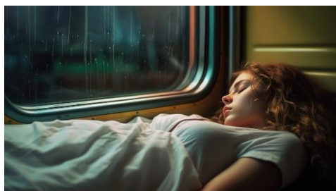
1. wagon sypialny –

Zad. 2 Podpisz poniższe ilustracje w języku angielskim związane z podróżą koleją .