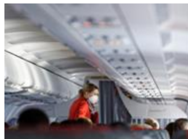
3. stewardessa –