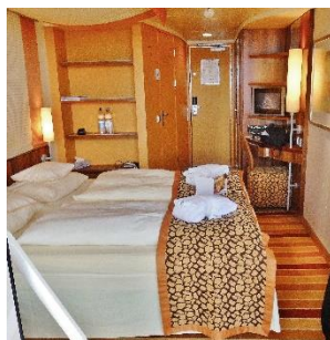
8. kajuta, kabina –