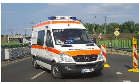
7. wezwać karetkę –