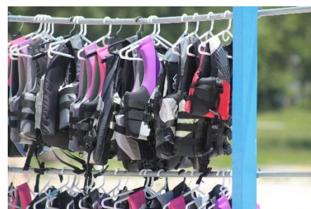
3. kamizelka ratunkowa –