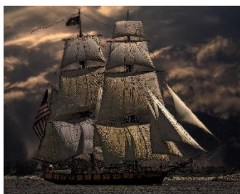
2. żaglowiec –