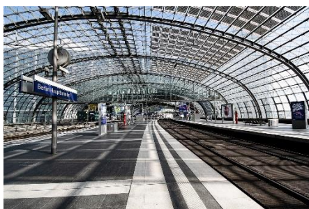
5. dworzec kolejowy –