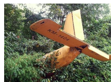
9. katastrofa lotnicza –