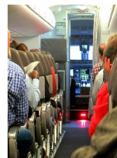
12. przejście –