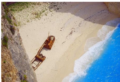
1. nabrzeże –

Zad. 3 Podpisz poniższe ilustracje w języku angielskim związane z podróżą morską .