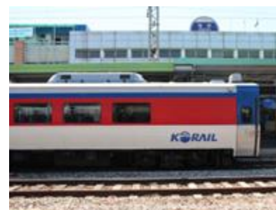
6. wagon –