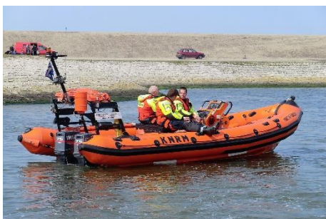
7. łódź ratunkowa –