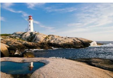
5. latarnia –