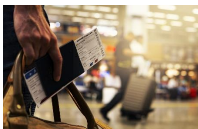
8. karta pokładowa –