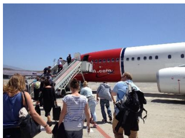
1. wsiadać do samolotu –

Zad. 1 Podpisz poniższe ilustracje w języku angielskim związane z podróżą lotniczą.