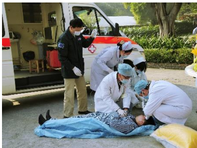
1. udzielać pierwszej pomocy –

Zad. 4 Podpisz poniższe ilustracje w języku angielskim związane z wypadkami .