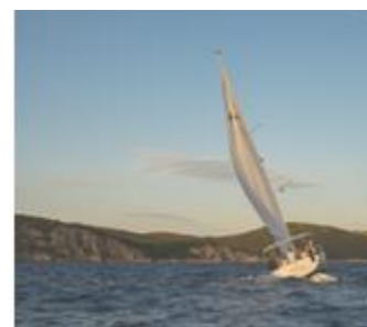
12. żagłówka –