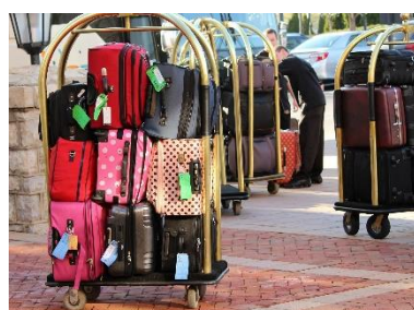
4. bagażowy –