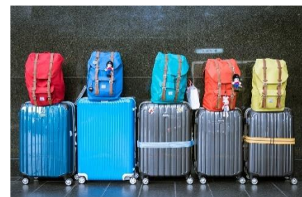
6. zostawić bagaż bez opieki –