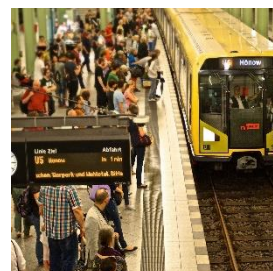
3. wsiadać do pociągu –