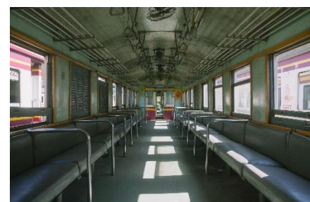
9. półka na bagaże –