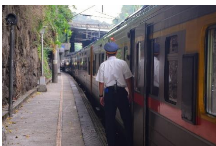
8. konduktor –