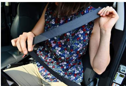
2. pas bezpieczeństwa –