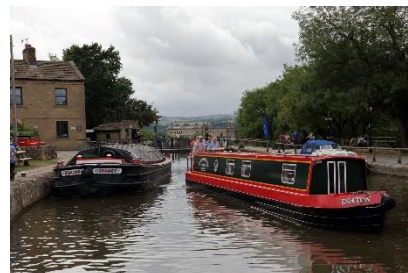
3. barka –