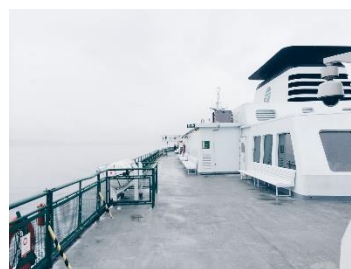
6. pokład –