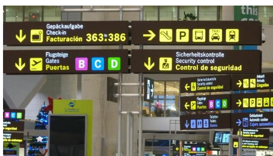
10. przejść odprawę paszportową –