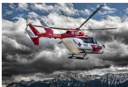
5. służby ratunkowe –