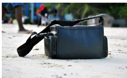
7. bagaż podręczny –