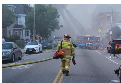
11. nagły wypadek –