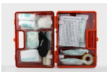
8. apteczka pierwszej pomocy –