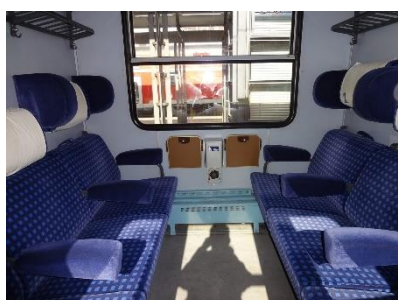
4. przedział –