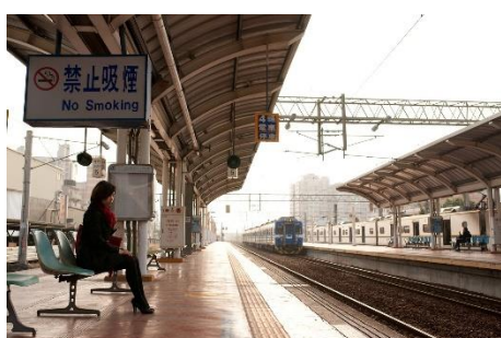
10. peron –