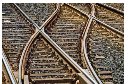
7. tory –