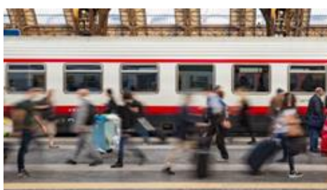
2. pasażerowie –