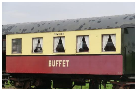
11. wagon restauracyjny –