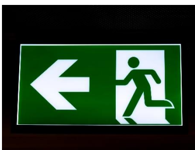
4. wyjście ewakuacyjne –