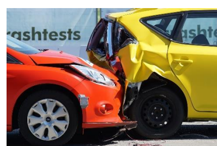
12. zderzyć się –