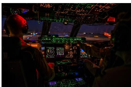
5. personel pokładowy –