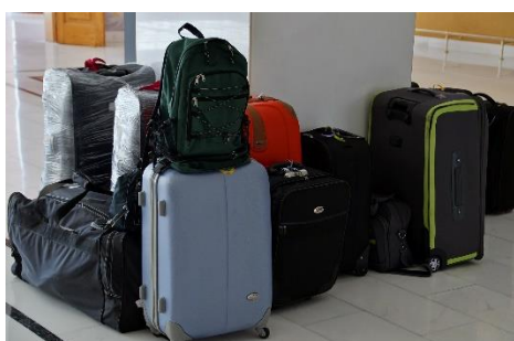
11. nadbagaż –