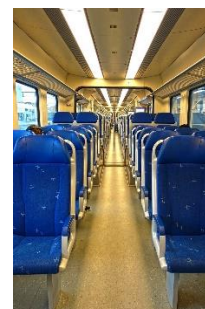
12. przejście –