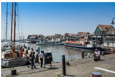
10. port –