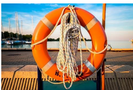
10. koło ratunkowe –