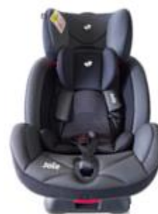
6. fotelik samochodowy –