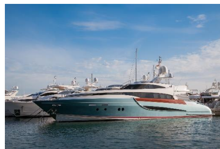
9. jacht –