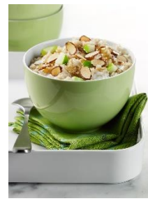
15. miska –