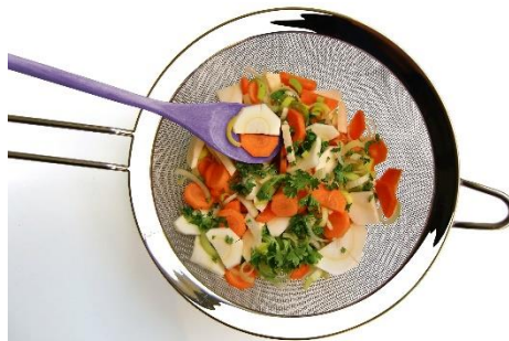
11. sitko –