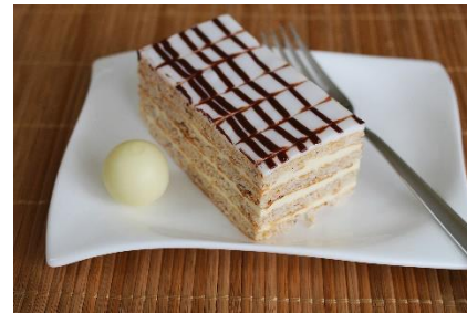
9. deser – dessert