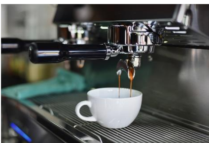
16. ekspres do kawy – coffee machine