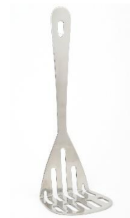
3. tłuczek do ziemniaków – potato masher