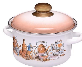
9. garnek – pot