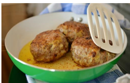
5. pulpety – meatballs