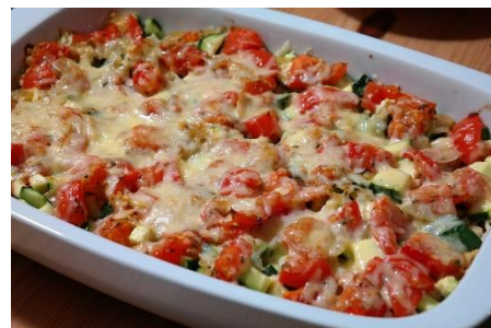
3. zapiekanka – casserole