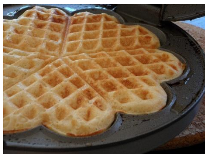
1. gofrownica – waffle iron

Zad. 1 Podpisz poniższe ilustracje w języku angielskim przedstawiające przybory i urządzenia kuchenne .