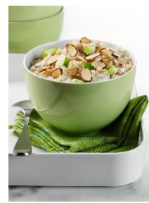
15. miska – bowl