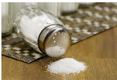
17. solniczka – salt shaker