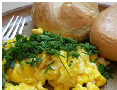
2. jajecznica – scrambled eggs