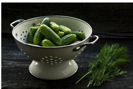
19. durszlak – colander