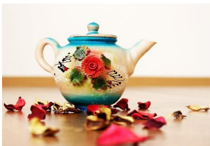
13. dzbanek do herbaty – teapot