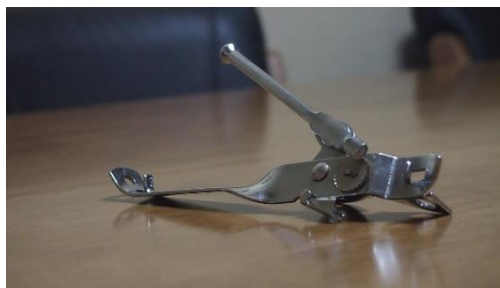
14. otwieracz do puszek – tin opener