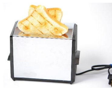
5. toster – toaster