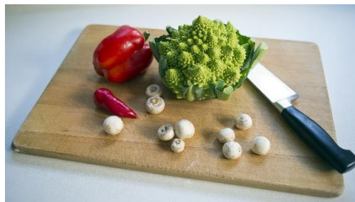
20. deska do krojenia – chopping board