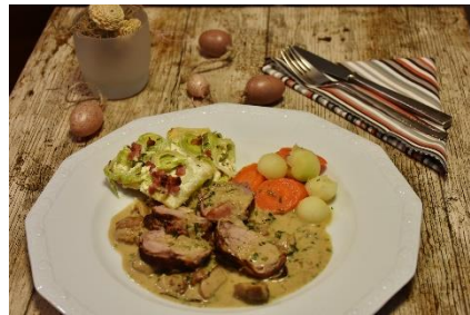
8. danie główne – main course