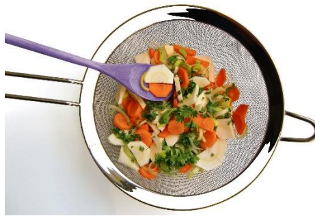
11. sitko – sieve