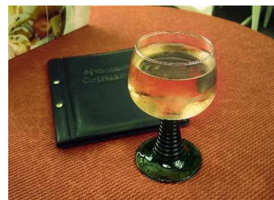
11. karta dań – menu