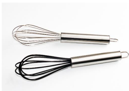
10. trzepaczka – whisk