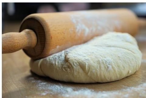
7. wałek – rolling pin