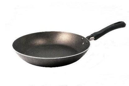
24. patelnia – frying pan