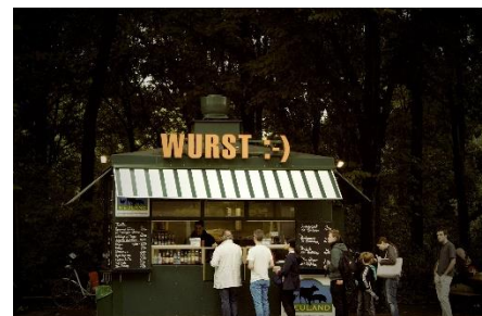
12. jedzenie na wynos – takeaway