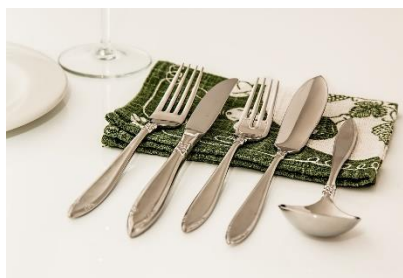
23. sztućce – cutlery