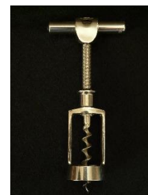
21. korkociąg – corkscrew