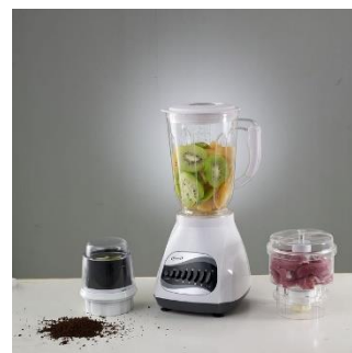
12. robot kuchenny – food processor