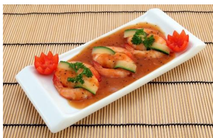
7. przystawka – starter