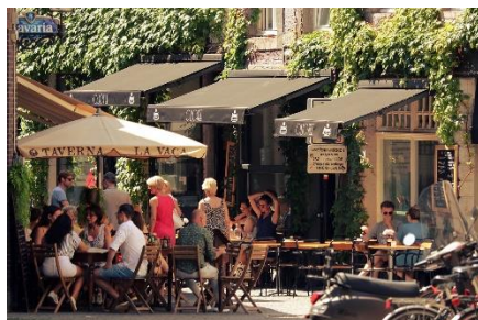
10. kawiarnia – café