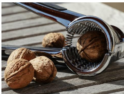
8. dziadek do orzechów – nutcracker