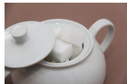
6. cukiernica – sugar bowl