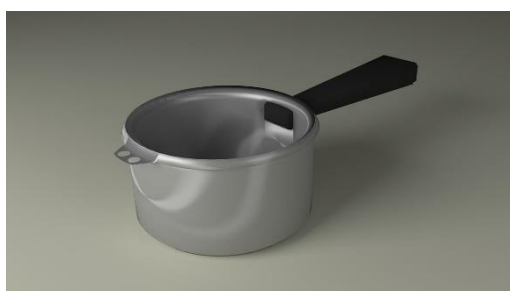
4. rondel – saucepan