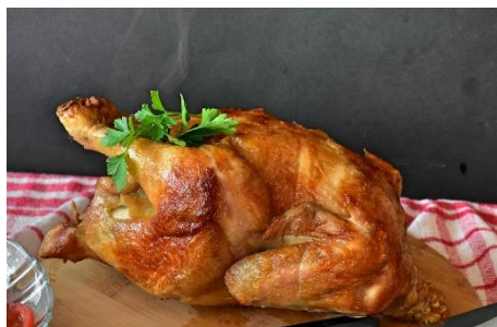
1. pieczony kurczak – roast chicken

Zad. 2 Podpisz poniższe ilustracje w języku angielskim przedstawiające dania oraz słówka związane z restauracją .