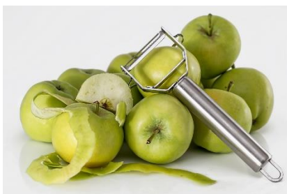
22. obieraczka – peeler