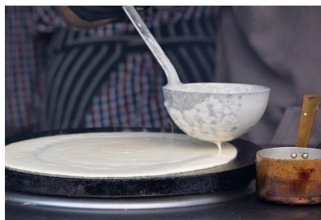
2. chochla – ladle