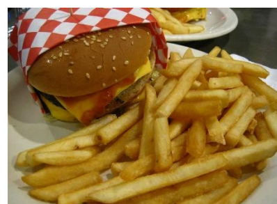
6. hamburger z frytkami – burger with chips