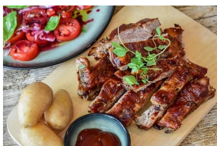
4. żeberka wieprzowe – pork ribs