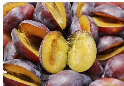
9. śliwka –