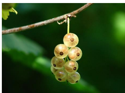
4. agrest –