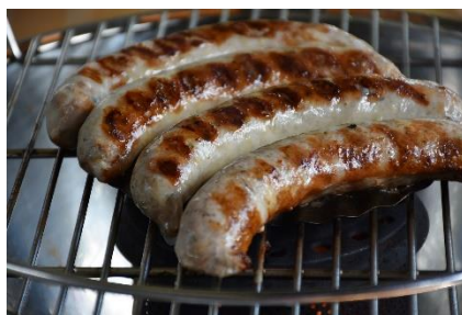
2. kielbasa –