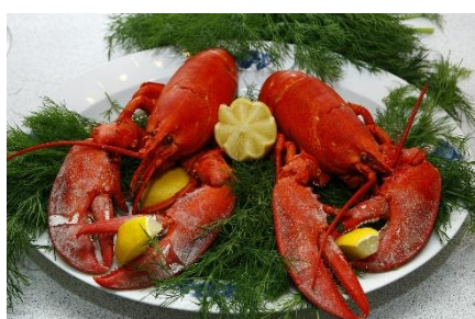
4. homar –