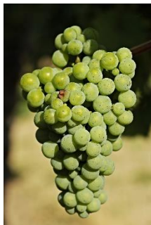
17. winogrona –