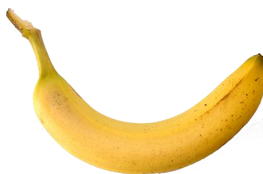
23. banan –