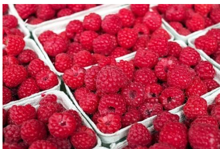
1. malina –

Zad. 1 Podpisz poniższe ilustracje przedstawiające owoce w języku angielskim.