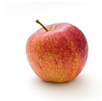
21. jabłko –