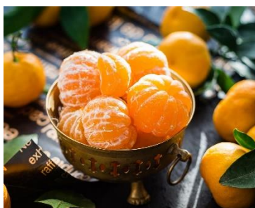
8. mandarynka –