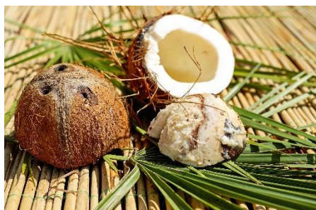
10. kokos –