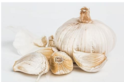
6. czosnek –