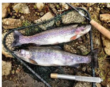
10. pstrąg –