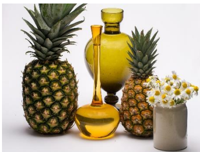
13. ananas –