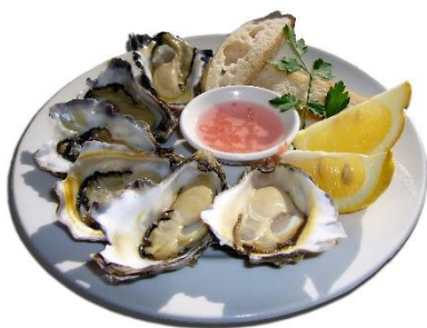
1. ostrygi –

Zad. 3 Podpisz poniższe ilustracje w języku angielskim przedstawiające mięso , ryby oraz owoce morza .