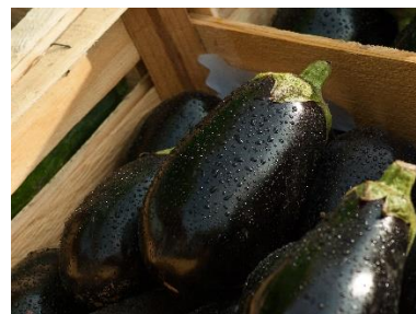
12. bakłażan –