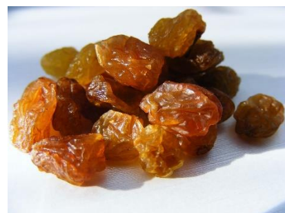
15. rodzynki –