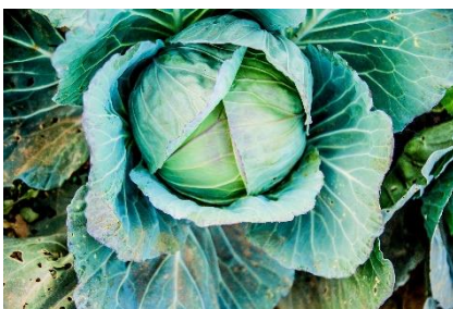
22. kapusta –