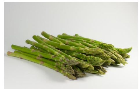
21. szparagi –