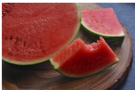
7. arbuz –