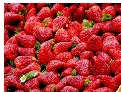
12. truskawka –