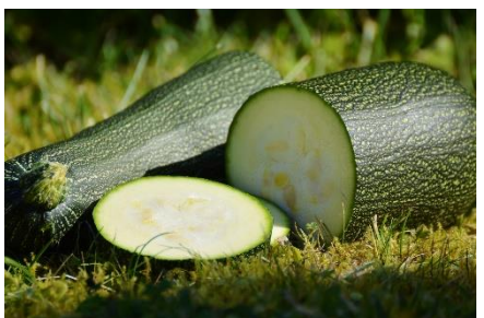
5. cukinia –