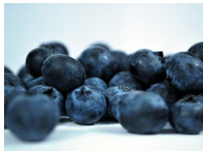
3. jagoda –