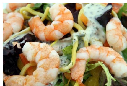
6. krewetki –