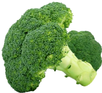
19. brokuł –