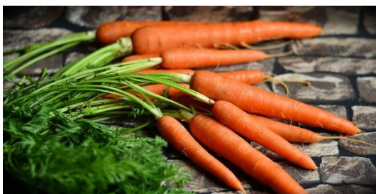
8. marchewka –