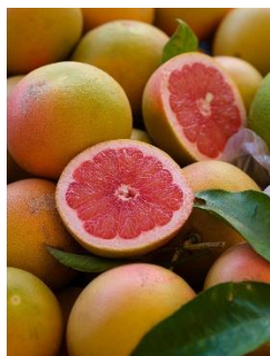
16. grejpfrut –