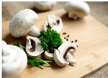
17. pieczarki –