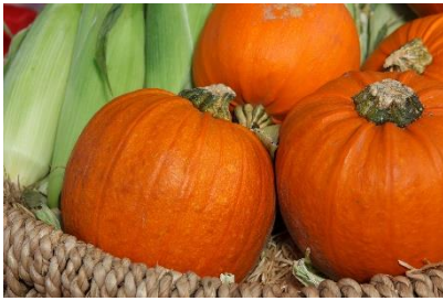
16. dynia –