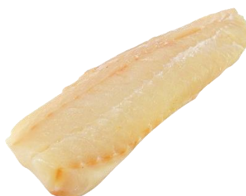
5. dorsz –