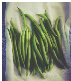
23. fasola szparagowa –