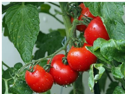
20. pomidor –