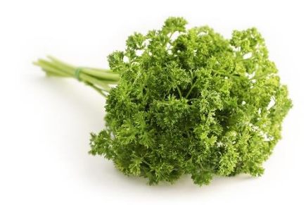
7. natka pietruszki –