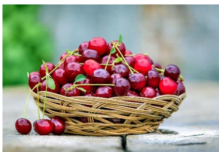
14. czereśnia –