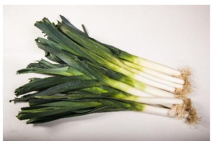
4. por –