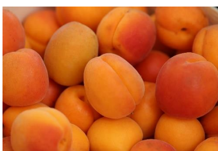
5. morela –