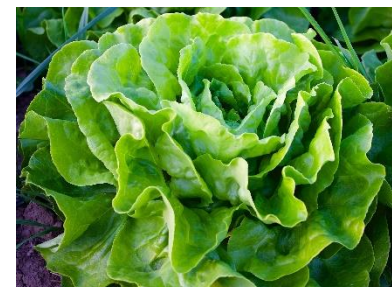
11. sałata –