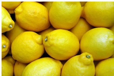
2. cytryna –