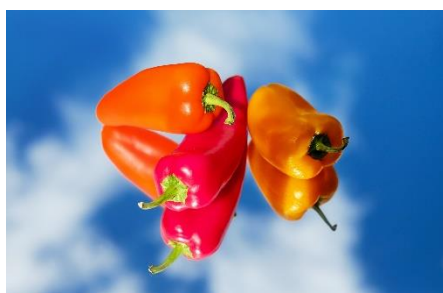
2. papryka –