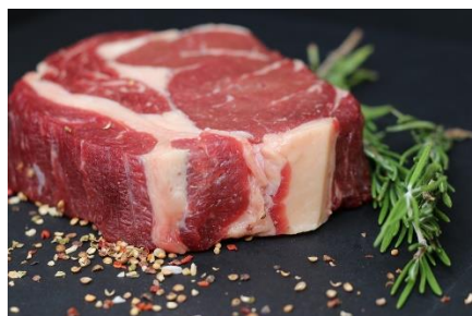
8. wołowina –