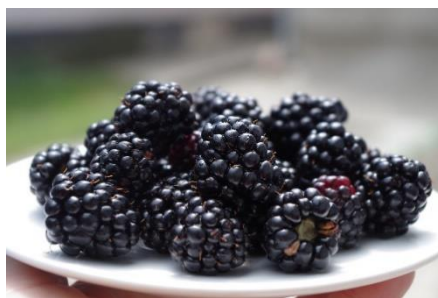
11. jeżyna –