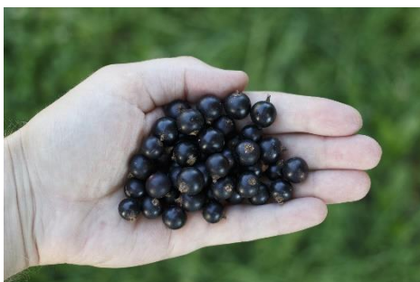
19. czarna porzeczka –