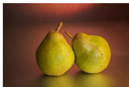
6. gruszka –