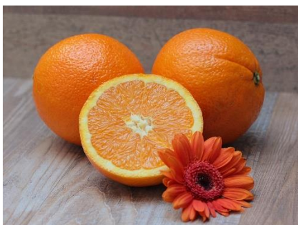
22. pomarańcza –