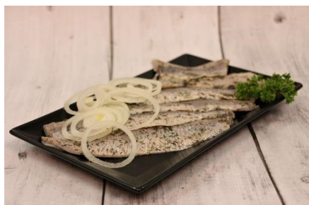
7. śledź –