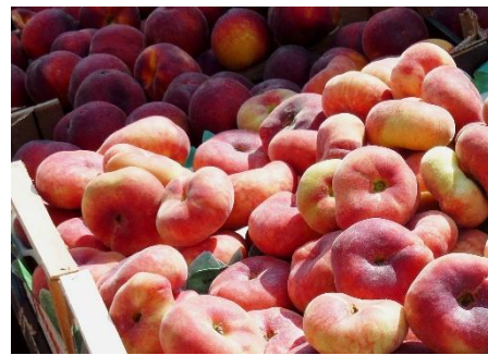
24. brzoskwinia –