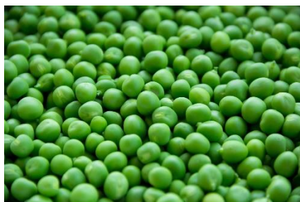
1. groszek zielony –

Zad. 2 Podpisz poniższe ilustracje przedstawiające warzywa w języku angielskim.