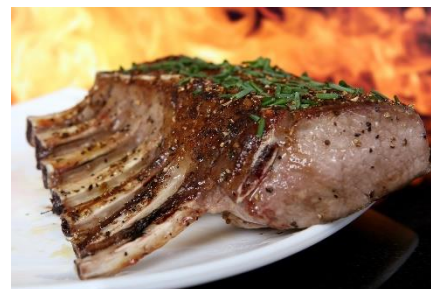
12. sarnina –