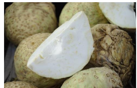
24. seler –