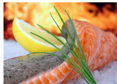
9. łosoś –