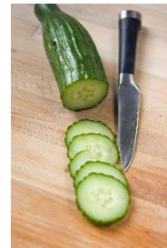
9. ogórek –