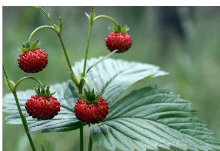
20. poziomka –