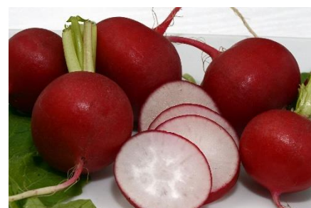
3. rzodkiewka –