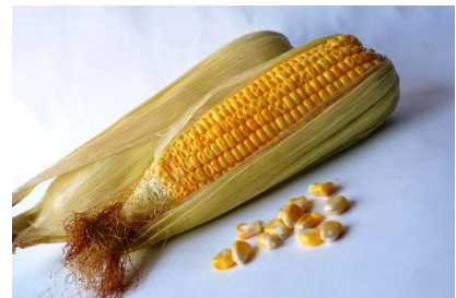
18. kukurydza –