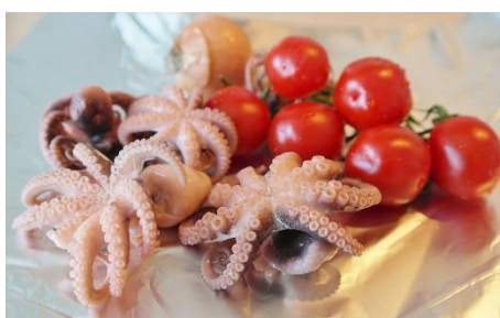
11. ośmiornica –