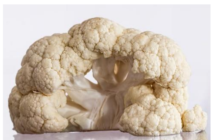
10. kalafior –