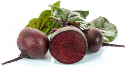
13. burak –