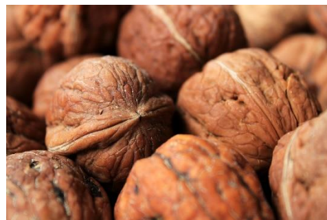
18. orzechy –