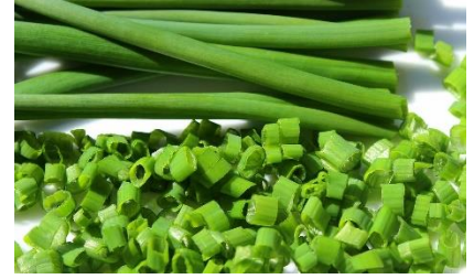
15. szczypiorek –