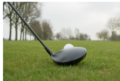
3. kij do golfa –