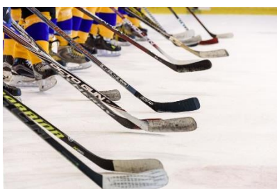
16. kij hokejowy –