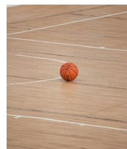
6. boisko do koszykówki –