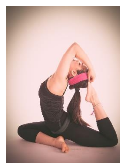
24. gimnastyka –