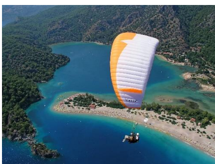
22. spadochroniarstwo –