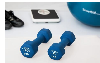
11. ciężarki –