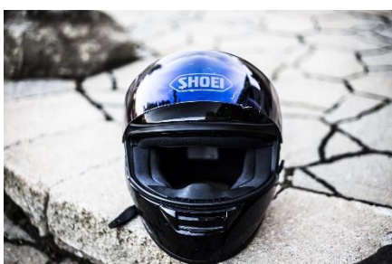
22. kask –