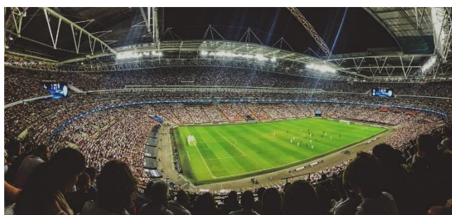
11. stadion –