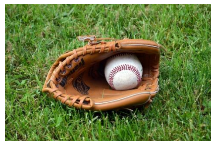
6. rękawica do baseballa –