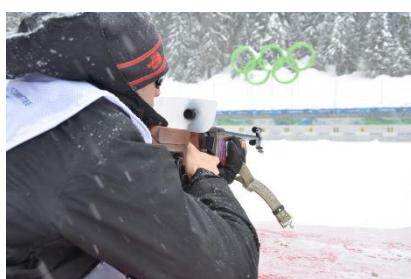
5. biathlon –