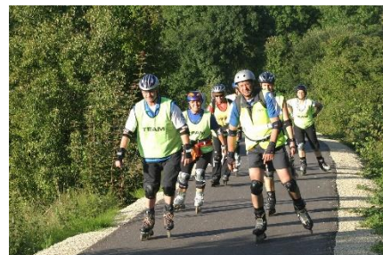
27. jazda na rolkach –