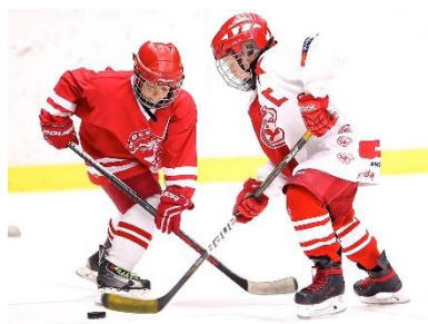
20. hokej –