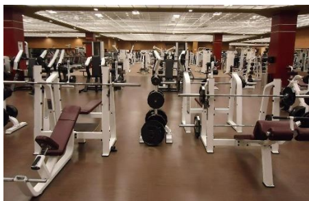
2. siłownia –