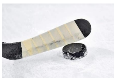
20. krążek do hokeja –