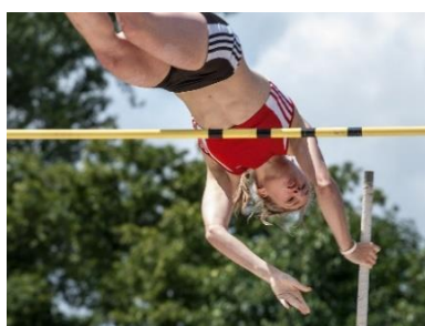
11. skok o tyczce –