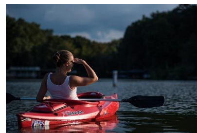
18. kajak –