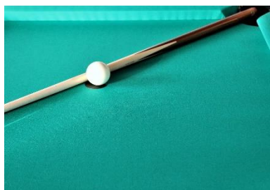
1. kij bilardowy –

Zad. 5 Podpisz poniższe ilustracje w języku angielskim przedstawiające sprzęt sportowy .