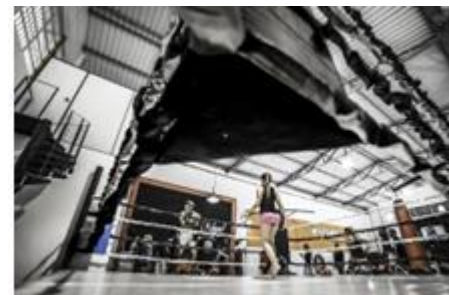
9. ring –