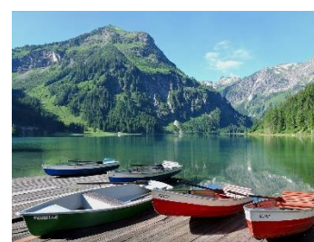
21. łódź wiosłowa –