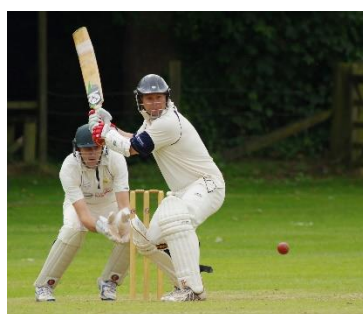
29. krykiet –