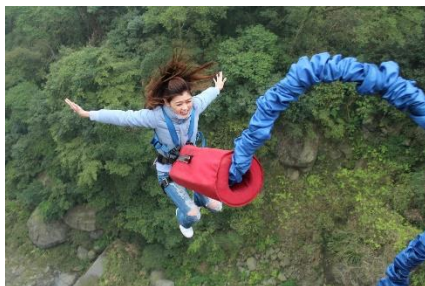
26. skok na bungee –