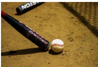
2. kij baseballowy –