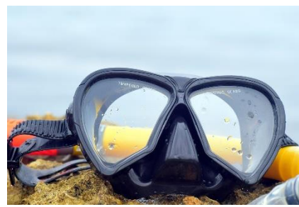
24. gogle do nurkowania –