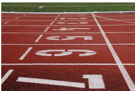
34. lekkoatletyka –