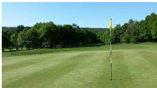
10. pole golfowe –