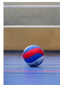
3. boisko do siatkówki –