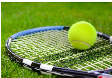
17. rakietka tenisowa –