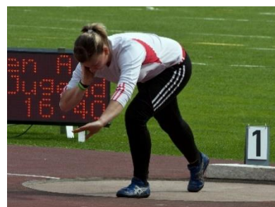
12. pchnięcie kulą –