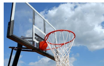
12. kosz –