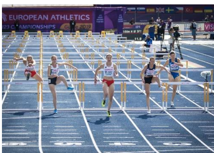
28. bieg przez płotki –