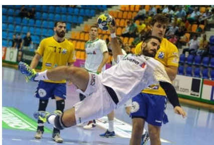
7. piłka ręczna –