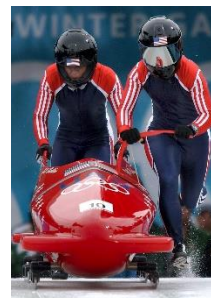
33. bobsleje –