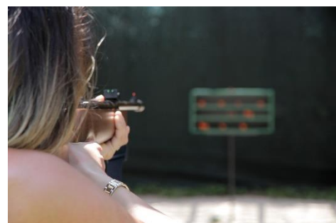
30. strzelectwo –