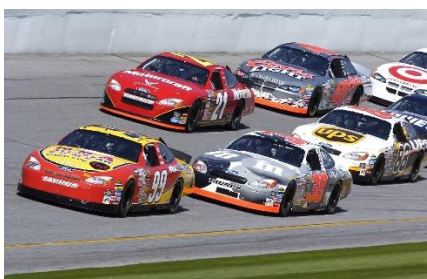
4. wyścigi samochodowe –