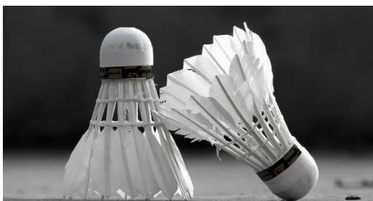
14. lotka do badmintonu –