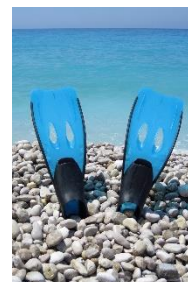
15. płetwy –