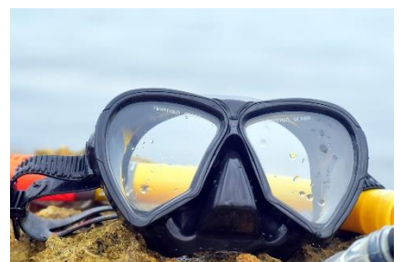
24. gogle do nurkowania – diving goggles