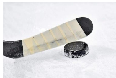
20. krążek do hokeja – puck