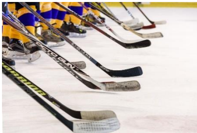
16. kij hokejowy – hockey stick