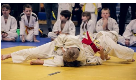
16. dżudo – judo