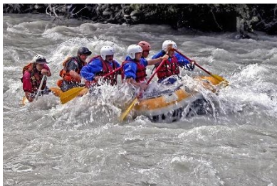
2. spływ górski – whitewater rafting