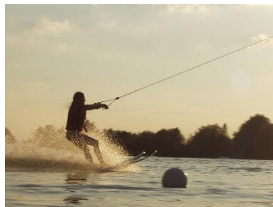
32. narciarstwo wodne – water-skiing