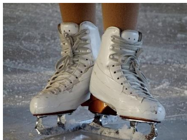
8. łyżwy – ice skates