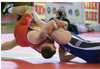
8. zapasy – wrestling