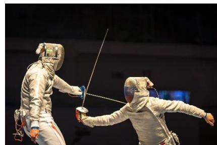
9. szermierka – fencing