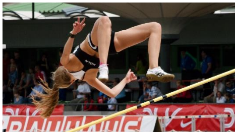
1. skok wzwyż – high jump

Zad. 1 Podpisz poniższe ilustracje przedstawiające dyscypliny sportowe w języku angielskim.