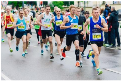
25. bieg długodystansowy – long-distance running