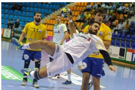
7. piłka ręczna – handball