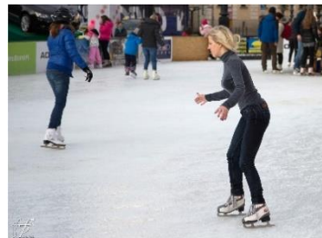
3. łyżwiarstwo – ice skating