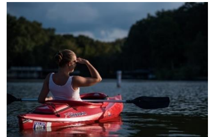
18. kajak – canoe