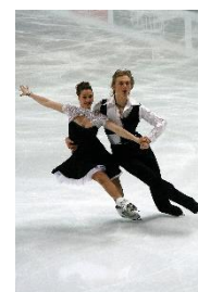
18. łyżwiarstwo figurowe – figure skating