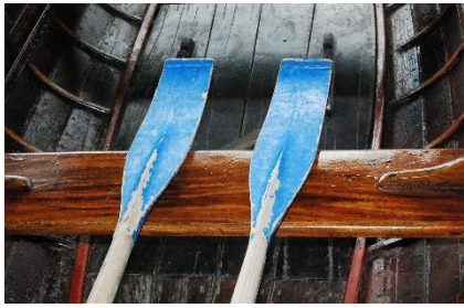
13. wiosła – paddles