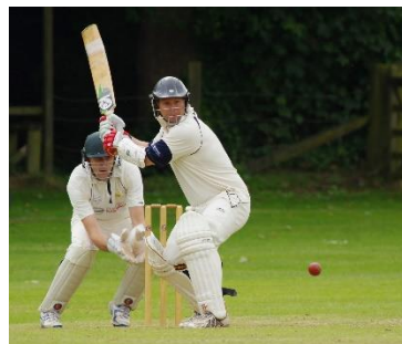
29. krykiety – cricket