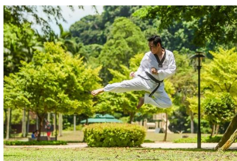
23. sztuki walki – martial arts