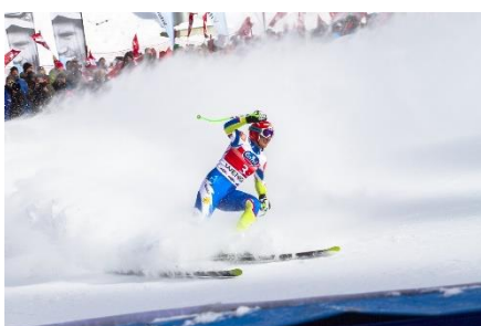
10. narciarstwo zjazdowe – downhill skiing