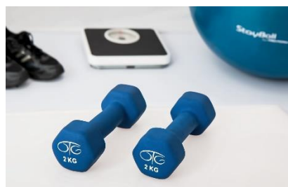
11. ciężarki – weights