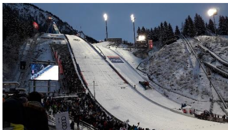
17. skoki narciarskie – ski jumping