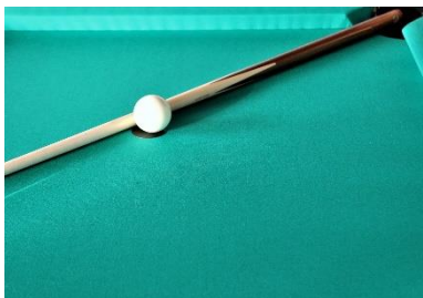
1. kij bilardowy – pool cue

Zad. 5 Podpisz poniższe ilustracje w języku angielskim przedstawiające sprzęt sportowy .