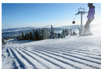
5. stok narciarski – ski slope