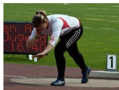
12. pchnięcie kulą – shot put