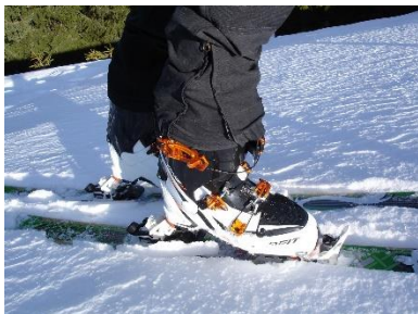
7. buty narciarskie – ski boots