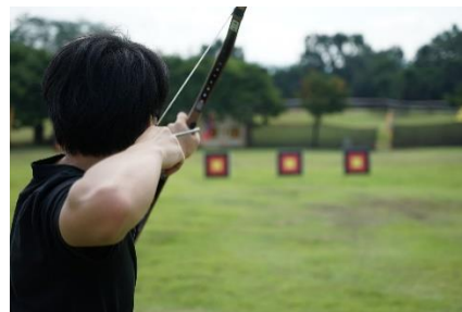
23. łuk – bow