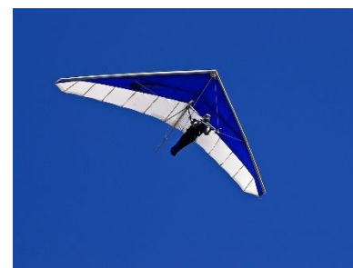
21. szybownictwo – gliding