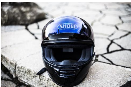
22. kask – helmet