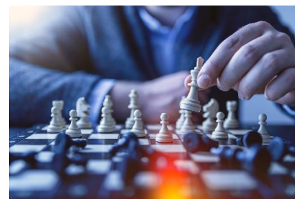
15. szachy – chess