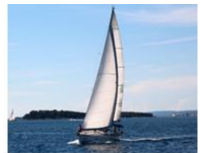
36. żeglarstwo – sailing