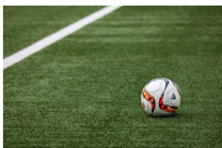
4. boisko do piłki nożnej – football pitch