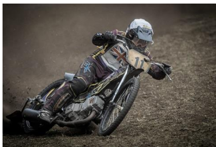
14. żużel – speedway