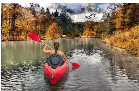
19. kajakarstwo – canoeing