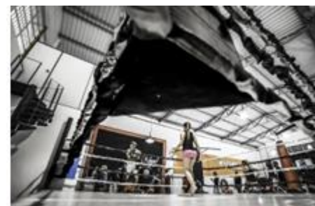
9. ring – boxing ring