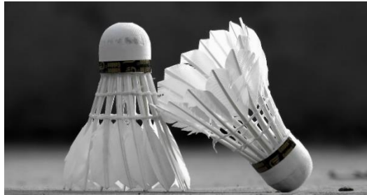
14. lotka do badmintona – shuttlecock