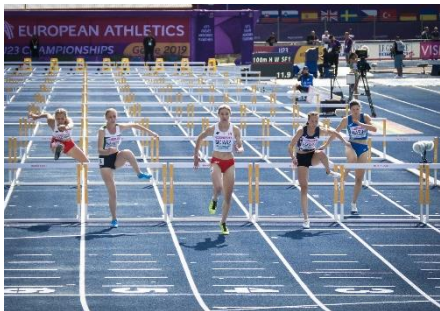
28. bieg przez płotki – hurdles