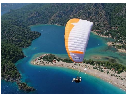
22. spadochroniarstwo – parachuting