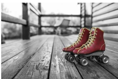
10. wrotki – roller skates