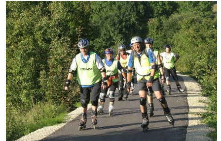
27. jazda na rolkach – rollerblading