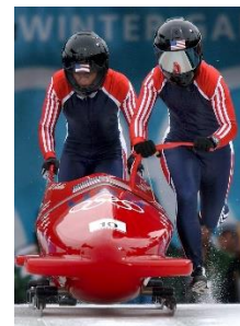
33. bobsleje – bobsleigh