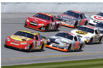
4. wyścigi samochodowe – motor racing