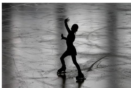
1. lodowisko – ice rink

Zad. 4 Podpisz poniższe ilustracje w języku angielskim przedstawiające miejsca do uprawiania sportu.