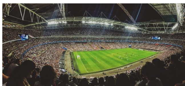
11. stadion – stadium