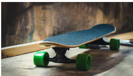
19. deskorolka – skateboard