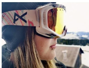
5. gogle narciarskie – ski goggles