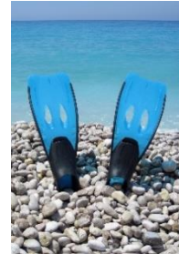
15. płetwy – flippers