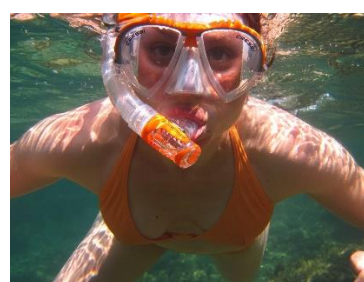
6. nurkowanie z rurką – snorkelling