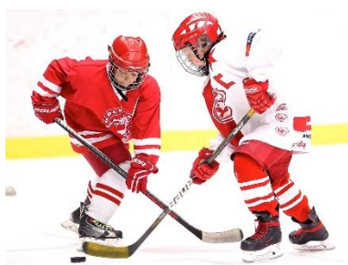
20. hokej – hockey