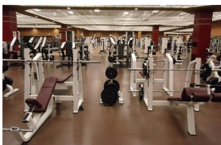
2. siłownia – gym