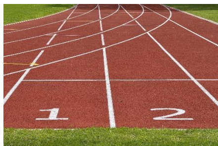
8. bieżnia – running track