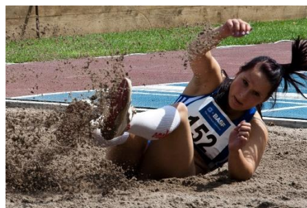
35. skok w dal – long jump