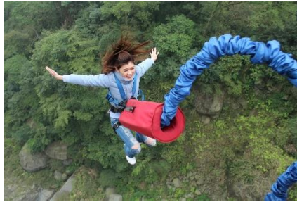
26. skok na bungee – bungee jumping