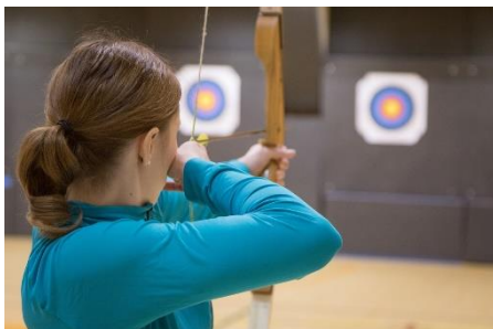
31. łucznicstwo – archery