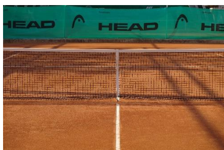
7. kort tenisowy – tennis court