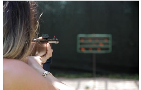
30. strzelectwo – rifle shooting