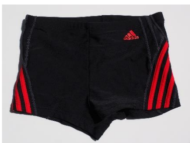
4. kąpielówki – swimming trunks