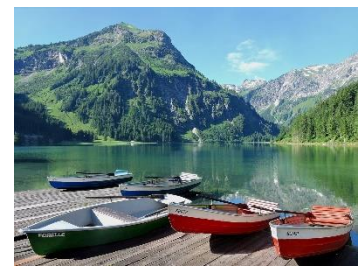
21. łódź wiosłowa – rowing boat