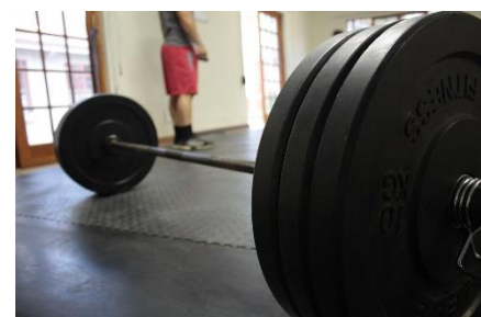
9. sztanga – barbell