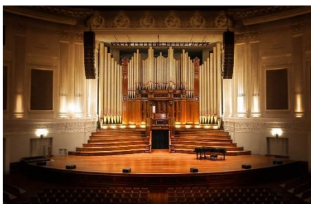
22. scena – stage