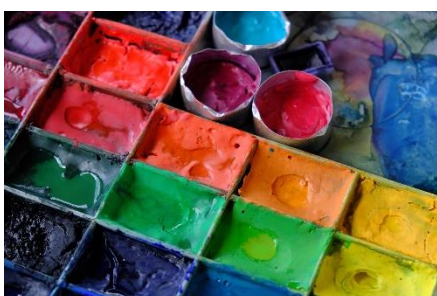
10. paleta – palette