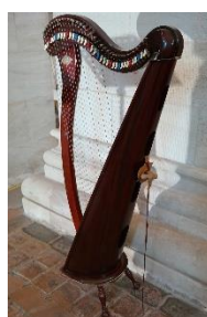
11. harfa – harp