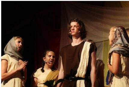
16. wystawiać sztukę – put on a play