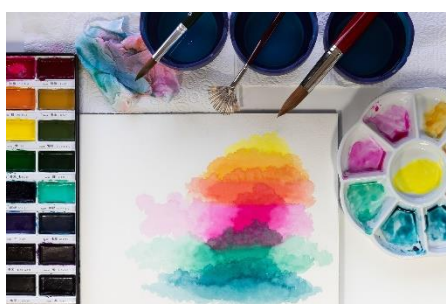
5. akwarela – watercolour