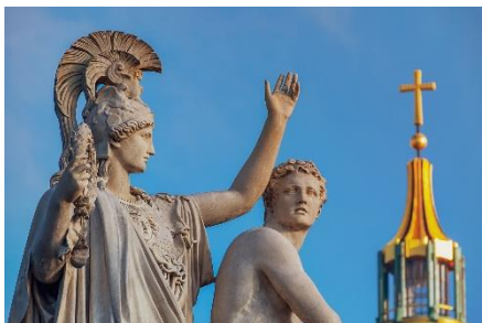
1. rzeźba – sculpture

Zad. 2 Podpisz poniższe ilustracje w języku angielskim przedstawiające słówka związane ze sztukami plastycznymi, filmem, teatrem i mediami .