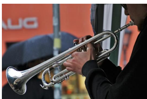
4. trąbka – trumpet