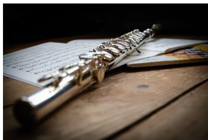
1. flet – flute

Zad. 1 Podpisz poniższe ilustracje w języku angielskim przedstawiające instrumenty muzyczne.