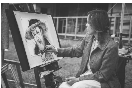
7. rysunek węgłem – charcoal drawing