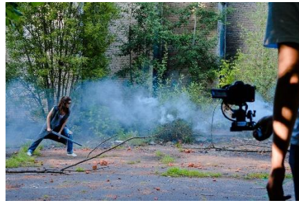
14. kręcić film – shoot a film