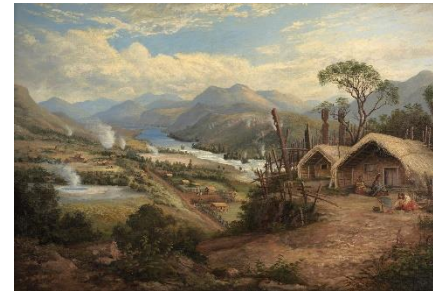
17. pejzaż – landscape