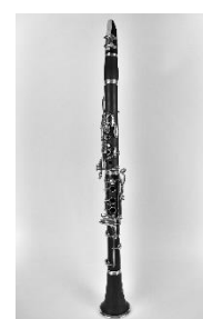
12. klarnet – clarinet