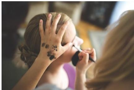
2. wizażystka – make-up artist