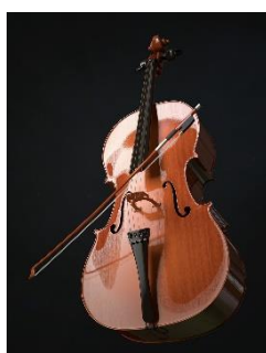
5. wiolonczela – cello