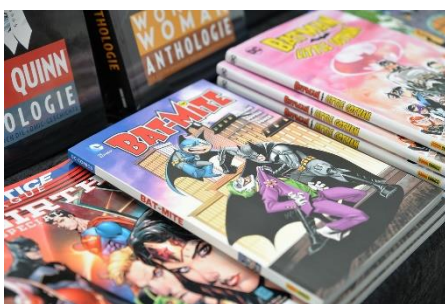
4. komiks – comic strip