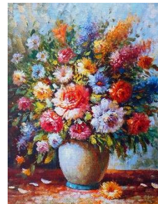
3. obraz olejny – oil painting