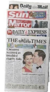
15. trafić na pierwsze strony gazet – hit the headlines