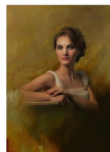
6. portret – portrait