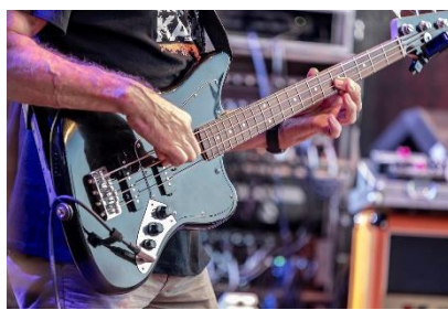
8. gitara basowa – bass guitar