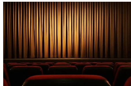
20. kurtyna – curtain