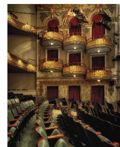
24. balkon – circle