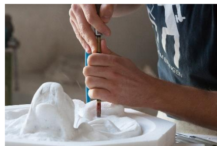
23. rzeźbiarz – sculptor