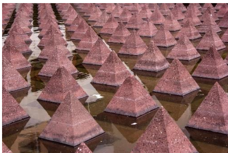
19. instalacja artystyczna – art installation