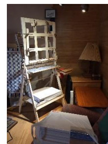
9. sztaluga – easel