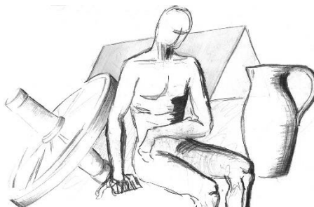
11. szkic – sketch