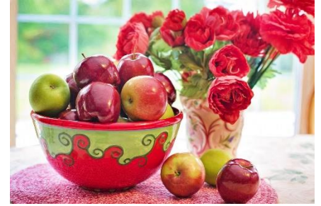
18. martwa natura – still life