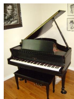
6. fortepian – grand piano