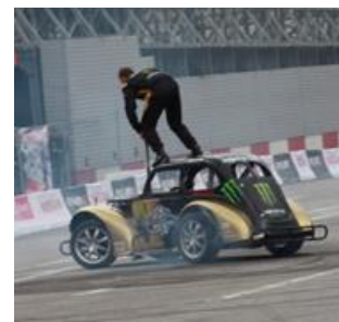
12. kaskader – stunt man