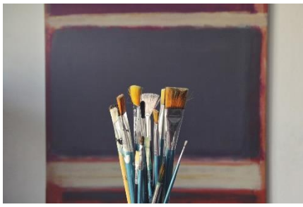
13. pędzle – brushes