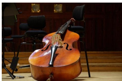
7. kontrabas – double bass