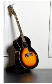
3. gitara – guitar