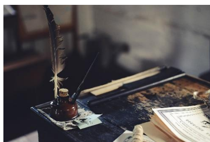
8. atrament – ink