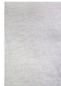
21. płótno – canvas