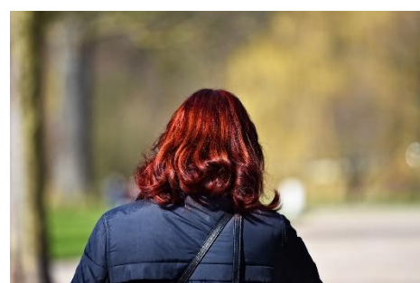
12. kasztanowe –