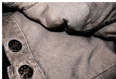
11. sztruksowy –