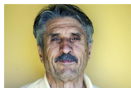
12. wąsy –