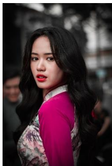
7. faliste –