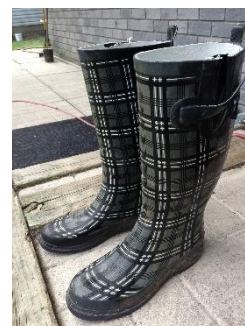
9. kalosze –