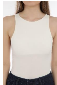
9. gładki, bez wzoru –