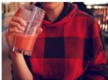
7. w kratę –