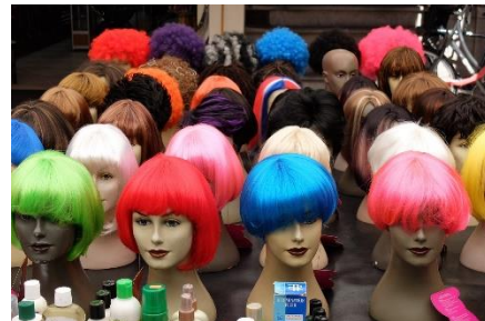
3. peruka –