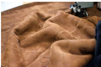
5. zamszowy –