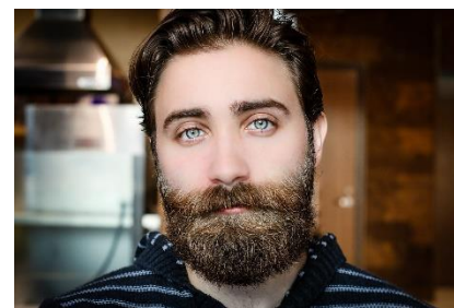
6. broda –