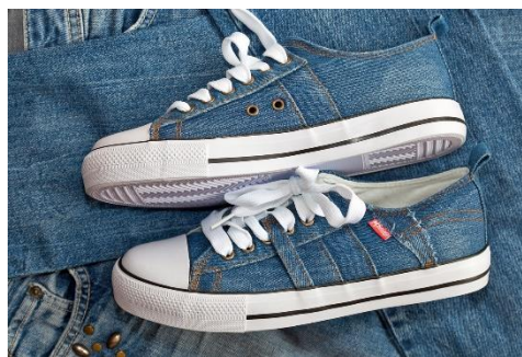
8. trampki –