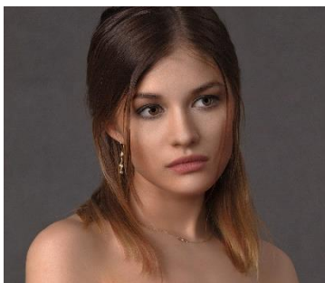
10. do ramion –