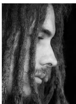
5. dredy –