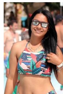
9. opalona cera –