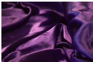
10. jedwabny –