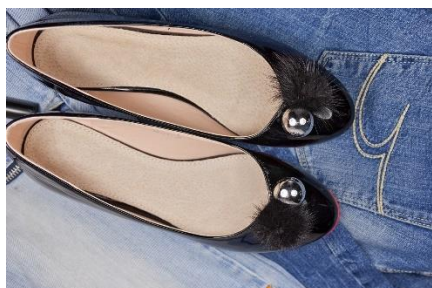
4. balerinki –