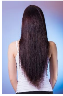
8. proste –