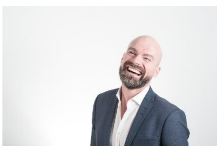
11. łysy –