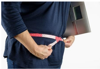
2. przytyć –