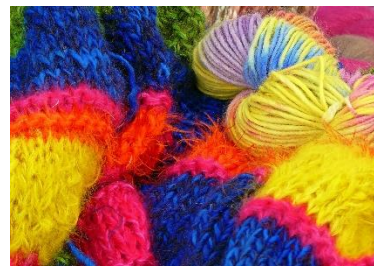
12. wełniany –