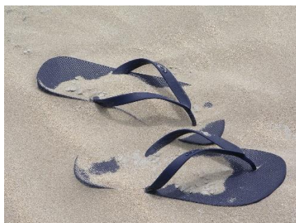
7. japonki –