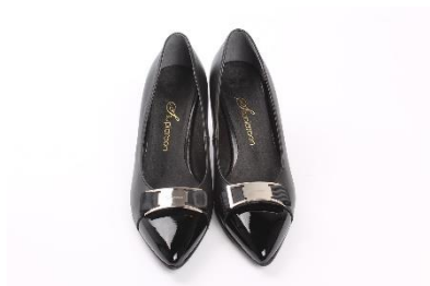
1. czółenka –

Zad. 3 Podpisz poniższe ilustracje przedstawiające obuwie w języku angielskim.