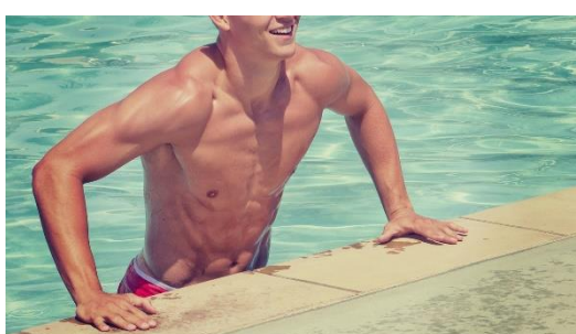
8. umięśniony –