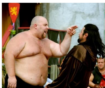
5. otyły –