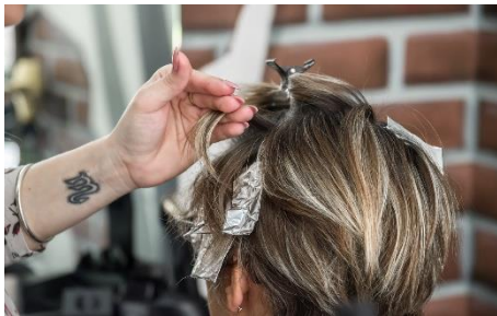
1. pasemka –

Zad. 2 Podpisz poniższe ilustracje związane z włosami w języku angielskim.