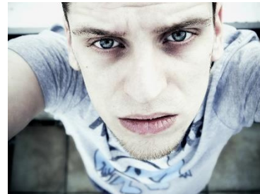
3. blada cera –