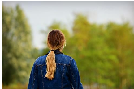
2. kucyk –