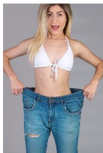
10. schudnąć –