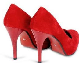
5. szpilki –