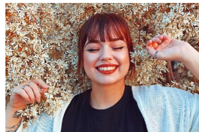
9. grzywka –