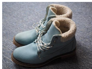
6. buty za kostkę na zimę –