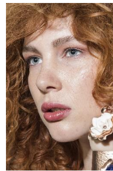
6. rude włosy –