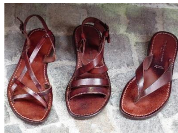
3. sandały –