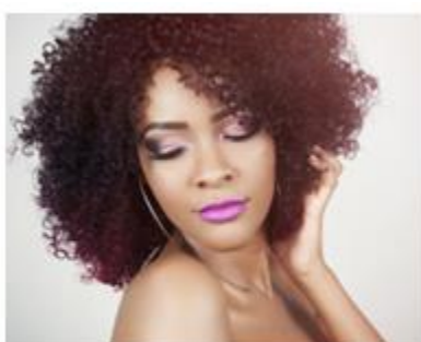
11. kręcone –