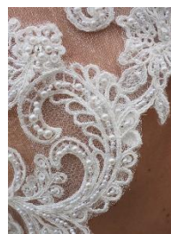
3. koronkowy –