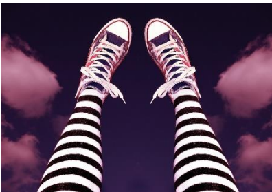
8. w paski –