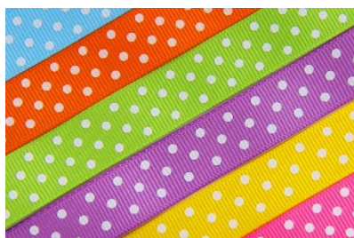
4. w kropki –