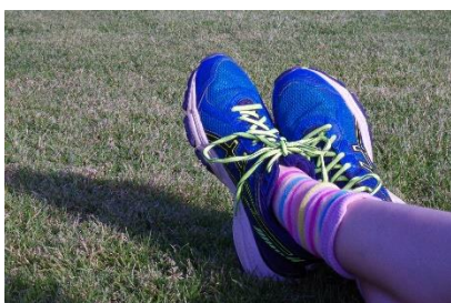
2. obuwie sportowe –