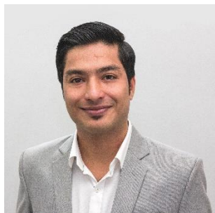
7. przystojny –