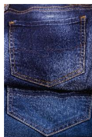
6. dżinsowy –