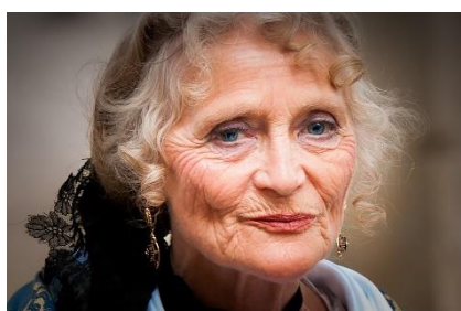
4. zmarszczki –