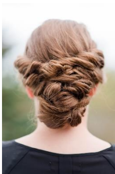
4. upięte w kok –