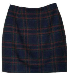
2. w szkocką kratę –